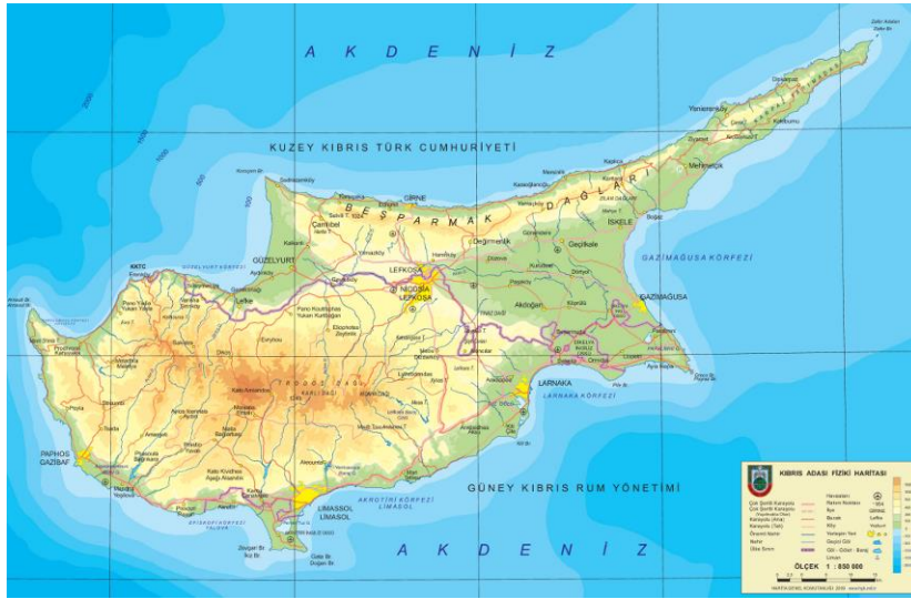
Kıbrıs Haritası ve KKTC

Kıbrıs, Akdeniz'in Sicilya ve Sardunya'dan sonra üçüncü büyük adasıdır. Tarihi M.Ö 7000'li yıllara kadar uzanan ada, 1571 yılında Osmanlı'lar tarafından fethedilerek Türk egemenliğine girmiştir. Osmanlı İmparatorluğu Birinci Dünya Savaşı'na Almanya'nın tarafında katılınca, 1925 yılında Kıbrıs Britanya tarafından ilhak edilmiş ve bir İngiliz Kolonisi haline gelmiştir. 1960 yılında Kıbrıslı Türkler ve Rumlar Kıbrıs Cumhuriyeti'ni kurmuşlardır. 1974 yılında adayı Yunanistan'a bağlama amaçlı bir darbenin ardından Türkiye adaya müdahale etmiştir. Müdahalenin ardından ada Kıbrıslı Türklerin yaşadığı kuzey ve Kıbrıslı Rumların yaşadığı güney arasında ikiye bölünmüştür. 1975 Yılında Kıbrıs Türk Federe Devleti kurulmuştur. 1983 yılında ise Kuzey Kıbrıs Türk Cumhuriyeti ilan edilmiştir. Başkenti Lefkoşa olan Kuzey Kıbrıs Türk Cumhuriyeti 'nin 2011 yılı verilerine göre toplam nüfusu 286,257'dir. Toprakları kuzeyde Dipkarpaz, batıda Güzelyurt, güneyde de Akıncılar'a doğru yayılır.