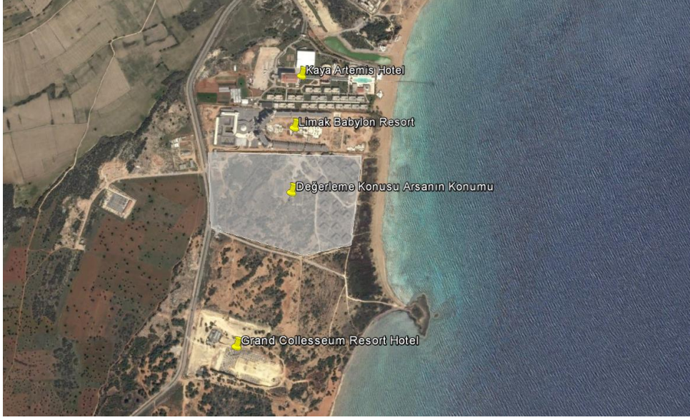
Değerleme Konusu Gayrimenkulün Konumu ve Yakın Çevresi Uydu Görüntüsü