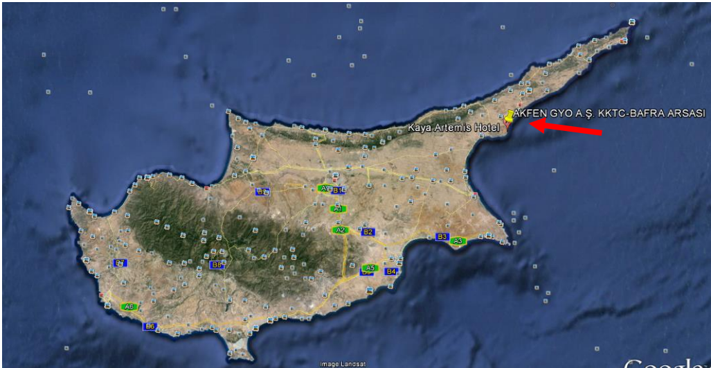
Değerleme Konusu Arsanın Konumu

Değerleme konusu taşınmazın sahil şeridinde yaklaşık 350 m. cephesi bulunmaktadır. Bölgeye ulaşımı sağlayan çift yönlü asfalt yol yapılmış olmasına rağmen Ercan Havaalanı'na uzak mesafede (~70 km.) olması bölgeye olan talebi olumsuz etkilemektedir. Değerleme konusu otel İskele şehir merkezine 20 km, Ercan Havaalanı'na 72 km, Gazimağusa şehir merkezine 45 km. uzaklıktadır.